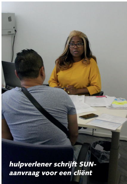
hulpverlener schrijft SUN-aanvraag voor een cliënt

giftenbudget ter beschikking stellen en hulp- en dienstverleners de aanvragen doen namens hun cliënt. SUN-noodhulpbureaus beschikken ook over maatschappelijk kapitaal: een tandarts brengt 10 gratis gebitsbehandelingen in, een opticien 15 geslepen brillen, enz. Meer over SUNN en onze rijke voorgeschiedenis die terug gaat tot het jaar 1914 kunt vinden op onze website www.sunnederland.nl .